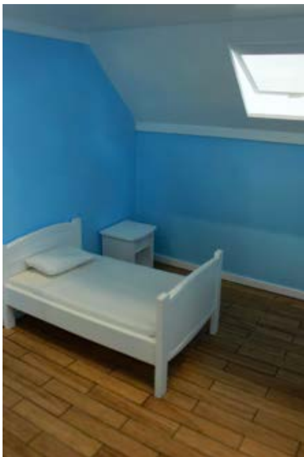
Camille SART –Premier souvenir

« Premier souvenir » maquette sur table ajustée, carton plume, bois, verre, vinyle autocollant ; armoire, dossiers judiciaires, plaques de verre ; magnétophone et casque, dimensions variables - 2016