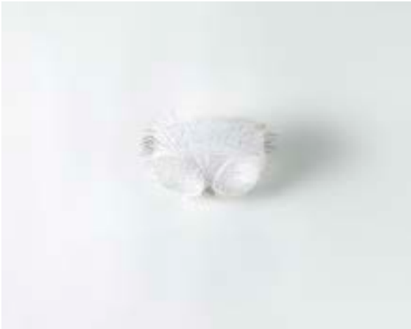
Jessy DESHAIS -Les petites culottes- © Atelier Find Art

"Les petites culottes" Organdi, eau sucrée, impression numérique, broderie, épingles, hameçons, dimensions variables, 2011 (courtesy Jessy Deshais)