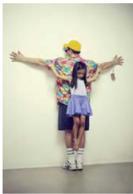
Erik RAVELO SUAREZ - Priest, Thailandia

« Priest », « Thailandia » - Deux photographies de la série « Les Intouchables »/ « The Untouchables »/ « Los Intocables », 70 x 36 chaque, 2013