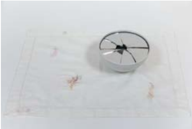
Sylvie KAPTUR-GINTZ - La parole étouffée – © Studio ADC

« La parole étouffée » - Set de table coton blanc brodé, 44 x 33 cm, bol de porcelaine blanche, miroir brisé, dimensions variables, 2023 (courtesy Sylvie Kaptur Gintz)