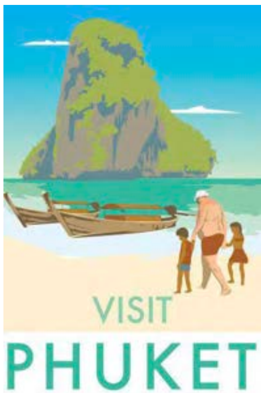
MONK – Visit Phuket – © Monk

« Visit Phuket » - Série « Visit » - Tirage sur papier affiche – 100 x 75 cm, 2016 - (courtesy Monk)