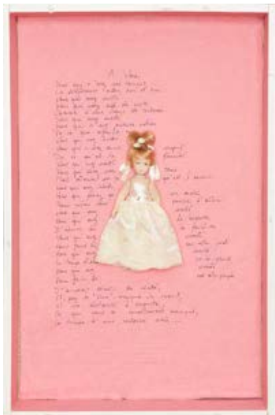
Anne PLAISANCE – Badrooms – © Anne Plaisance