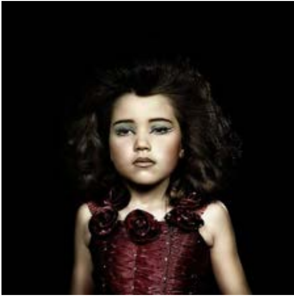
Tina WINKHAUS – Eternal Sadness

Deux photographies issues de la série « Eternal Sadness », 70 x 70 cm chaque, 2008