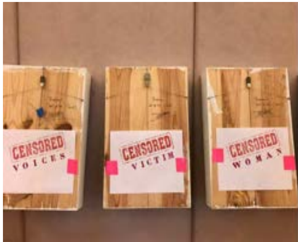
Photo d'oeuvres censurées, First Parish Unitarian Church of Lexington, Juin 2017, USA – Les boîtes ont été obturées par des panneaux de bois, l'artiste y a collé une affichette « Censored » – © Anne Plaisance

« Badrooms » Une douzaine de boîtes de la série «Badrooms» , technique mixte( papier ,peinture acrylique, poupées (vintage ou de collection), tissu, encre, bois, Plexiglas, pâte à papier, fil de fer barbelé, dentelle, perles...), 50 x 33 x 9 cm chacune, depuis 2014 – (Courtesy Anne Plaisance)