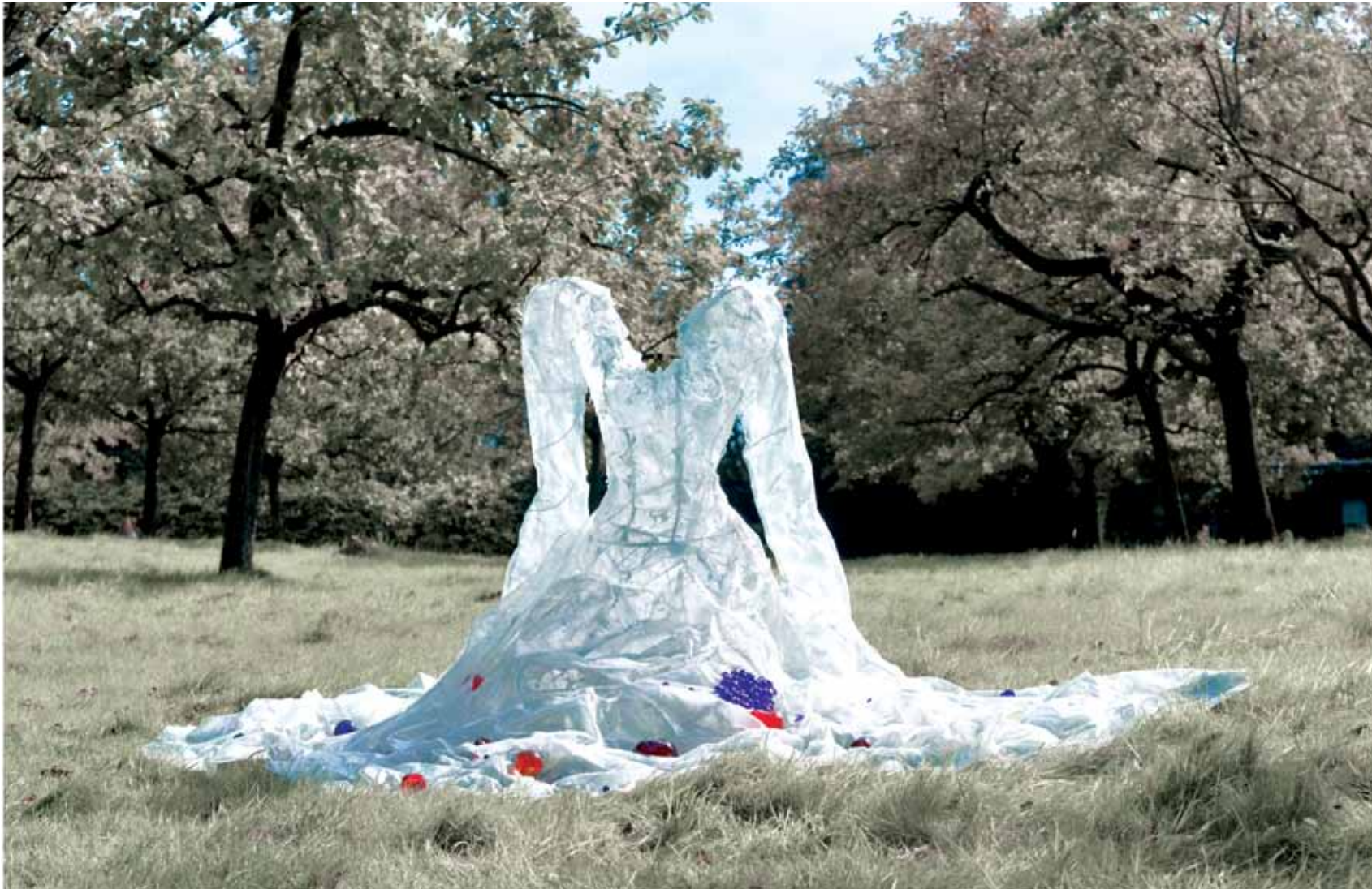
Psyché ou la langueur aux pommes

Piet.sO 2011 photo: Piet.sO et Gaëlle Carlier résine souple sur structure en fil d'aluminium 2,00 x 1,70 x 1,10m